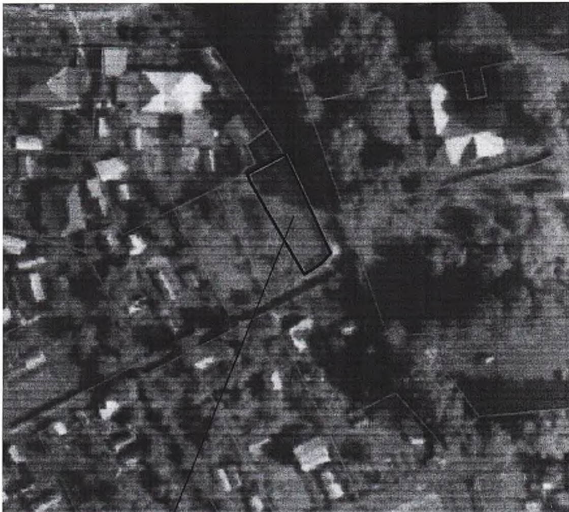
Схема расположения земельного участка в окружении смежно расположенных земельных участков (Ситуационный план)